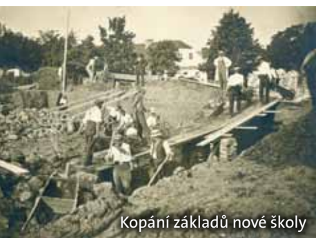
Kopání základů nové školy