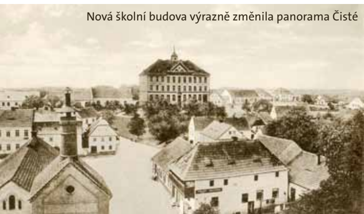
Nová školní budova výrazně změnila panorama Čisté