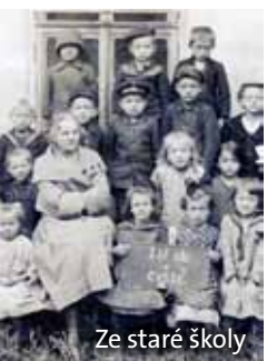
Ze staré školy