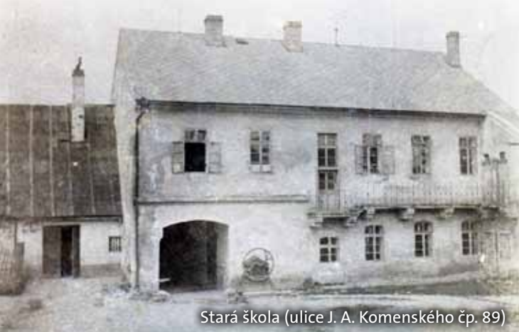
Stará škola (ulice J. A. Komenského čp. 89)