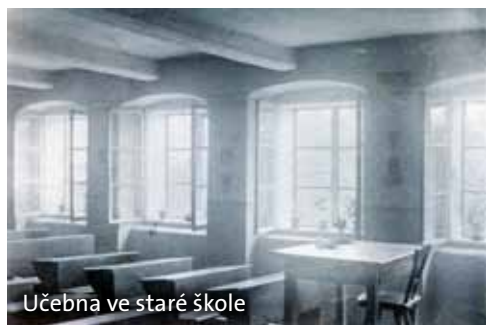
Učebna ve staré škole